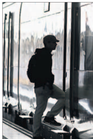
Un pasajero sube a un tren en una estación de Adif.

locidad Madrid-Valladolid-Norte con las líneas Madrid-Sevilla y Madrid-Levante. En total, serán 37 kilómetros de los que 7,3 discurrirán por el nuevo túnel Atocha-Chamartín. Con este acuerdo, Siemens se responsabilizará de la modernización del enclavamiento electrónico situado en la estación de Chamartín y de su ampliación y realizará la adaptación del Centro de Tráfico Centralizado (CTC) de las líneas de alta velocidad Ma-