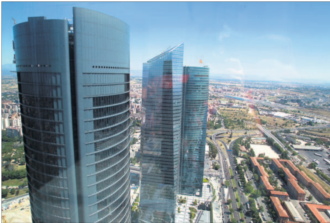
En primer término, la Torre PwC, uno de los activos de Testa, adquirida por la socimi Merlin a Sacyr. PABLO MONGE

“Por tipo de inversores, las socimis y los fondos de inversión fueron los más activos, seguido de inversores privados y promotores inmobiliarios, entre otros”, se señala en el comunicado de esta asociación. El 49% del volumen correspondió a compras por parte de estas So-